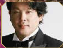
タミーノ 望月 哲也 (テノール) Tetsuya Mochizuki (Tenor)